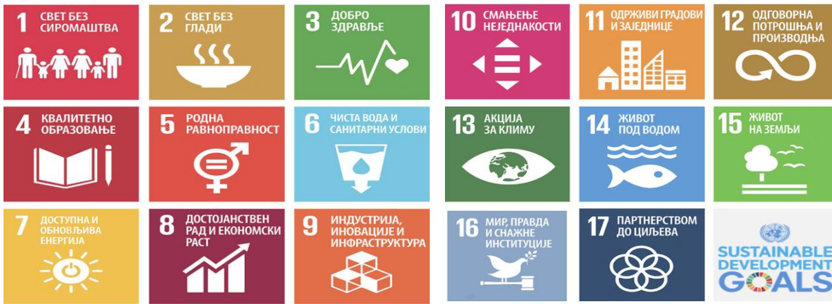
Слика бр. 1 - Циљеви одрживог развоја (Sustainable development goals)

Када се говори о еколошки прихватљивој контроли, сузбијању и уништењу штеточина и алергених биљака, то се обично односи на употребу нетоксичних пестицида који су одрживи и ефикасна замена за традиционалне методе контроле штеточина и алергених биљака, које се у великој мери ослањају на опасне хемикалије. Еколошки прихватљива контрола штеточина и алергених биљака такође укључује интегрисане стратегије управљања штеточинама и алергеним биљкама које су дизајниране да минимизирају присуство штеточина и штетних биљака кроз тактике превенције и уништења. Ове комбиноване стратегије помажу у уклањању штеточина без наношења штете људима, кућним љубимцима или животној средини.